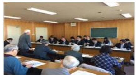
↑ 昨年12月に実施された懇談会

上記の6分野の要望事項について事前に文書回答を求め、それにもとづき担当部課との懇談を申し入れました。本年度は、①国保・後期高齢者医療、②介護保険、③生保、子ども医療費、障がい者施策の3回に分けて懇談を予定しています。介護保険の改善に関する懇談では、介護事業所へのアンケートを実施したさい、市との懇談会に参加を希望した事業所にも参加を呼び掛ける予定です。